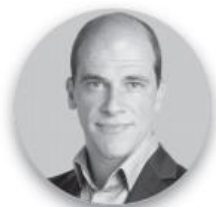
Diederik Samsom (voorzitter)

Onderhandelaar voor het landelijk klimaatakkoord